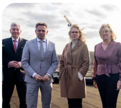
Bezoek minister 2026