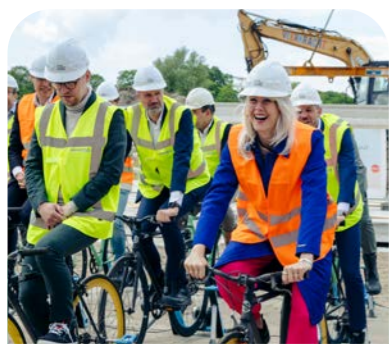
Bezoek minister 2025

De wijk Merwede en het door de eigenaren opgerichte Merwede LAB laten zien hoe we de uitdagingen binnen gebiedsontwikkeling gezamenlijk kunnen aanpakken en bouwen aan een toekomstbestendige leefomgeving. In Merwede werken ontwikkelaars samen aan het beste plan voor toekomstige bewoners, de stad én de planeet.